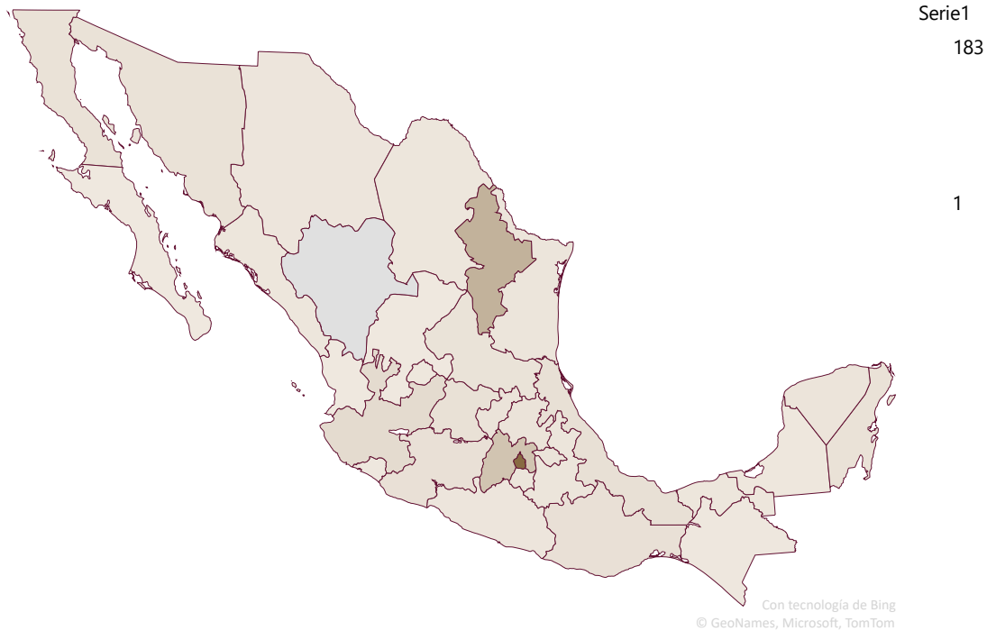
GRÁFICA 2. QUEJAS POR ENTIDAD FEDERATIVA DE PRESUNTOS ACTOS DISCRIMINATORIOS. ENERO DE 2023 A JUNIO DE 2024

La LFPED establece medidas administrativas y de reparación con la finalidad de prevenir y eliminar la discriminación; del 1 de enero de 2023 al 30 de junio de 2024, se verificó el cumplimiento o cancelación de 888 medidas: 540 administrativas y 348 de reparación, 30 las cuales se componen de expedientes de seguimiento por convenio o acuerdo de trámite, resoluciones por disposición y expedientillos de mediación durante la orientación.